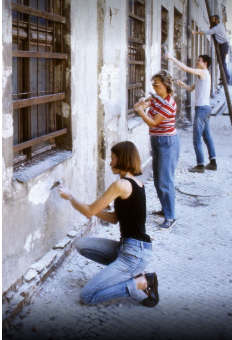
Dortustrasse Potsdam 1989.