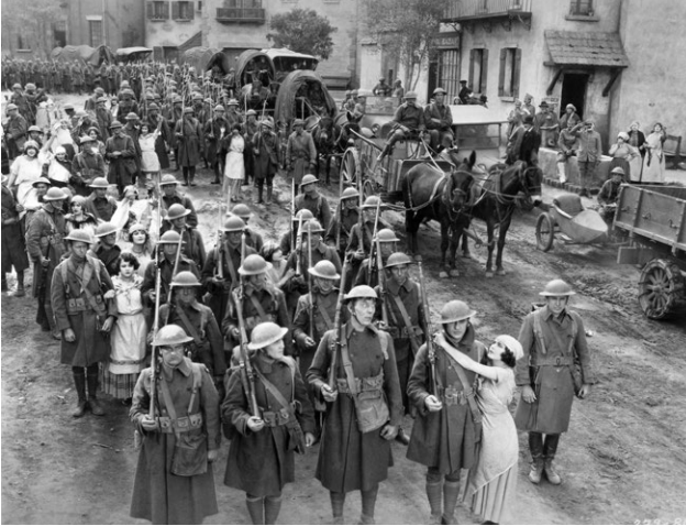
↗ Die große Parade (USA 1925)