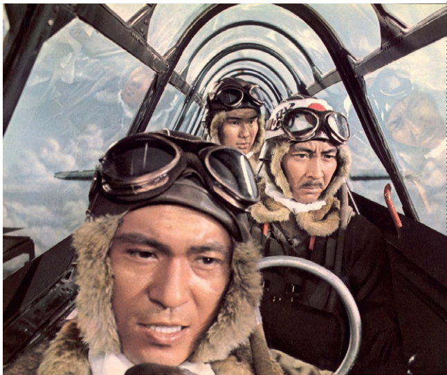
▲ Tora! Tora! Tora! (USA/JPN 1970)

Veranstaltungen des Forums Neuer Markt im Filmmuseum Potsdam mit Film und Diskussion Start jeweils um 18.00 Uhr