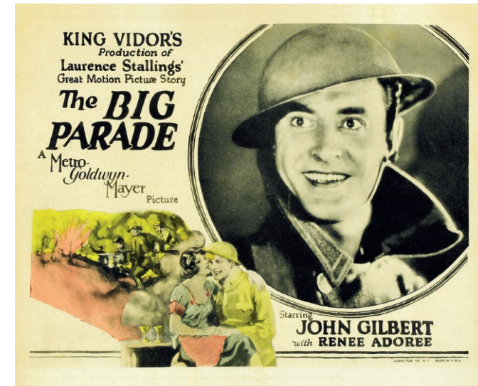
▲ Die große Parade (USA 1925)

Organisation: Deutsches Kulturforum östliches Europa und HBPG